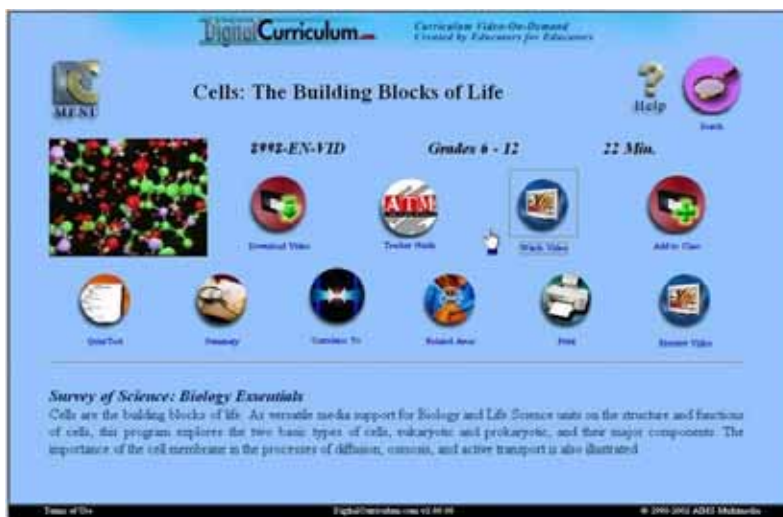
Video Detail Screen

DCc 數位課程影片的主要核心來源正是舉世聞名的「AIMS 多媒體影片圖書館」，其中知名的得獎教育影集包括有，像 Scared Straight(嚇阻·現身試法--1978 奧斯卡最佳紀錄片獎)，The Teen Files(青少年檔案--2002 艾美獎)，McGruff® The Crime Dog (兒童預防犯罪防治教材)，和 Judith Viorst's Alexander 系列。加上 2002 年冬季所增列的 150 部新片，目前已達 1,250 個教學影片。此一數位課程圖書館基本上可歸類成四個齡級--即小學、國中、高中、大學與成人。另外還有一些重要特點：譬如，只有 DCc 介面，教師可以對學生做線上評量。如果學生答錯了線上測驗題，螢幕將跳出一個測驗複習影片片段(Quiz Review Video Clips)，讓學生加強學習以獲取正確的答案，測驗過後，其測驗結果將自動 E-mail 儲存於教師之「Log file」文件夾裡。除了訂製試題外，如果教師想為學生出題目，自己也可以於線上設計試題。