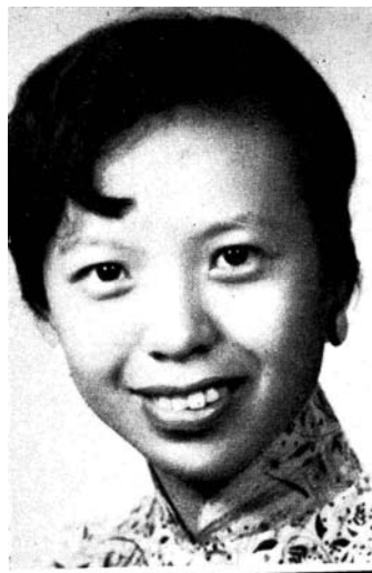
取自第一屆畢業紀念冊

10 月，因 823 砲戰發生，悼念砲戰中失蹤的朋友，撰寫〈無邪愛--為懷念金門砲戰中失蹤的記者 W·S 君而寫〉 10 。