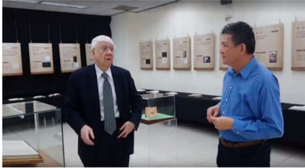
中央研究院劉炯朗院士

院士 9 點即抵達，彭館長親自陪同這位敬重的長輩看了聖經展，然後經過一 F 資料檢索區，眼尖的他立刻看到許多與最近失火巴黎聖母院的書籍展示，他驚訝又讚美。「劉院士大大讚美圖書館，讓學校主管都開心。下午四點，我陪校長送貴賓，校長高度肯定我們所做的」彭館長說。