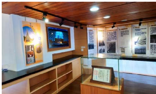
「東海的地標、台中的驕傲，路思義教堂獲頒國家古蹟展」

4 月 26 日，路思義教堂獲國家列為古蹟頒獎的社會議題中，就是「結合熱門時事，讓曝光效益大翻倍！」的作法。圖書館在 5 月 1 日即刻推出「東海的地標、台中的驕傲，路思義教堂獲頒國家古蹟展」。並且，即時回應「路思義教堂施工工程的程序」。當日，正好也是名建築師貝聿銘 102 歲的生日。