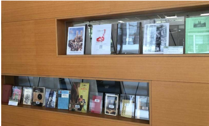
《巴黎聖母院》主題展

2019 年 4 月 15 日 18 時，位在法國巴黎西堤島的「巴黎聖母院」發生了嚴重的火災，失火點位於教堂閣樓處，屋頂幾乎全毀，尖頂坍塌與建築主體中後部的木質屋頂倒塌....，「巴黎聖母院」是法國首都巴黎的重要地標，許多法國內外人士在此藏著時光的記憶。消息一公開後，圖書館即刻在讀者服務組暨數位服務組同仁與館長討論後，並作成下列幾點決議：首先在 1 樓「資訊檢索區」配合時事推出《巴黎聖母院》 2 主題書展。