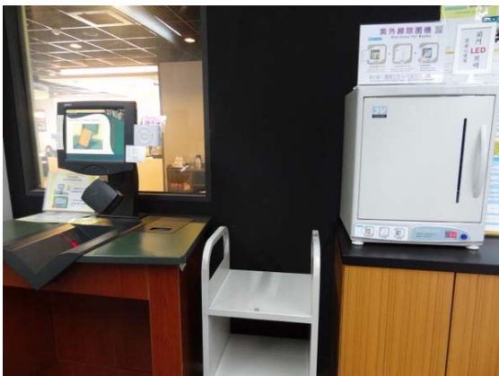
除菌機的外型與擺放位置

關心讀者的安全，特別要求廠商在安裝時，需用儀器實地測量有無幅射線或發熱而燙傷使用者，測試後瞭解「除菌機」不會發生傷及人體的問題，請讀者安心以並善加使用。