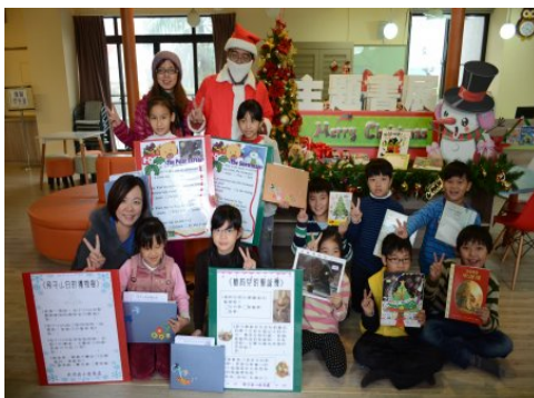
(圖十)彰化縣湖北國小—「經典閱讀協奏曲創意閱讀課程」：

結合聖誕節慶祝活動，特別推出與閱讀教育結合的「聖誕主題書展」及「聖誕說書」兩個活動，並搭配有獎徵答活動，鼓勵學生踴躍閱讀、大量閱讀及用心閱讀，讓全校師生感受不同的聖誕節歡樂氣氛。