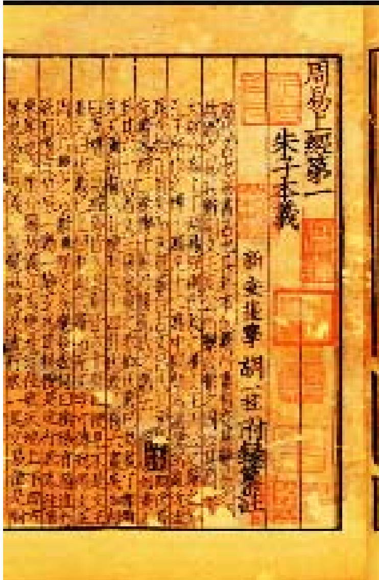
北京保利 2016 年春拍元刊《易本義附錄纂疏》書影

又現知北京保利 2016 年春拍有一部元刊胡一桂著《易本義附錄纂疏》十五卷八冊，有蒲坂書藏印記，應是漏網。而是書或即著錄於某氏所編《蒲坂書樓藏書目錄》之「元版周易朱子本義/八本」。