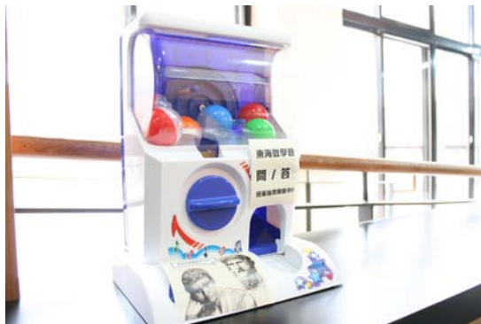
推廣配合扭蛋機讓許多讀者覺得有趣

在有限的預算之內，我們盡可能的強化讀者參與時的可能誘因，一方面在獎勵品策略上做足安排，亦在時間策略上有所限制，也配合活動規則，讓讀者可以發揮社群力量，將好友、同學帶來一起參與。最後，我們也在活動本身上強化動機，添置了一台趣味十足的扭蛋機，讓同學可以在充滿期待與歡樂中進行抽獎。