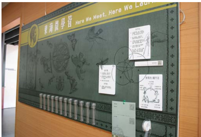
經過多次調整微學管終於完成

2016 年 11 月，本館舉辦了創藝圖書館系列競賽，包含攝影、書籤設計和行銷企劃三個項目，希望透過競賽展現同學特長，也能有效表達對於圖書館現況的看法。賽後，我們從行銷企劃比賽的參賽作品中，挑選預算和執行上都相對容易的項目嘗試操作。這便促成了這次我們推出的「東海微學管：問答互動牆」。