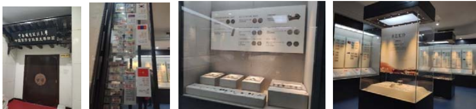
(圖 40：貨幣金融歷史博物館)(圖 41：各國錢幣)(圖 41 及 42：各國古錢幣)

貨幣金融歷史博物館位於圖書館一樓，館內的收藏主要是從古至今的錢幣，例如春秋時代的刀幣及銅錢；目前正在展出由中國銀行贊助的一帶一路各國錢幣特展，很特別的是，特展的各國錢幣是以浮貼的方式，黏在可以拉出的玻璃牆上，這種展出的方式是很少見的；在博物館的網站中，可以看到 360 度全景的博物館導覽( http://sosomap.cn/api/view/pano/zncdhhbirlsbwg )。