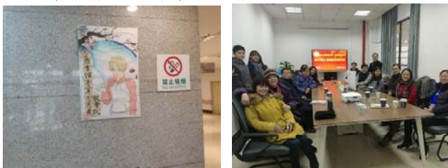
(圖 49：志願者招募海報)

武漢科技大學圖書館的志願者服務隊也非常特別；志願者服務隊基本上由學生社團脫胎而來，總數突破千人，已經可以自我管理，館員每年僅僅只是提供志願者優先的自修空間、工作學習及工讀的機會，其餘的訓練工作基本上由資深的志願者學長姐帶領新進的學弟妹工作學習，這樣的志願者團隊確實對圖書館的日常工作起了非常大的作用。