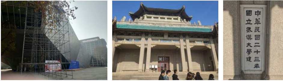
(圖 27：武漢大學博物館)(圖 28：武漢大學老櫻頂圖書館)(圖 29：武漢大學老櫻頂圖書館的民國紀年)

武漢大學博物館則是一個純粹展示的博物館，館內沒有特別展覽的主題跟館藏，我們參訪的時候，展出的是恢復高考 40 年的特展；武漢大學在中國恢復高考有一個重要的地位，1977 年在「科學與教育工作座談」上，時任武漢大學化學系副教授的查全性向鄧小平建議恢復高考，從當年開始實施，這個決定改變了那時年輕人的命運，也為後來的改革開放提供了人才的基礎。