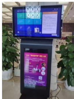
(圖 25 及 26：武漢大學圖書館與 Wiley 和 Ebsco 的推廣活動及電子海報)