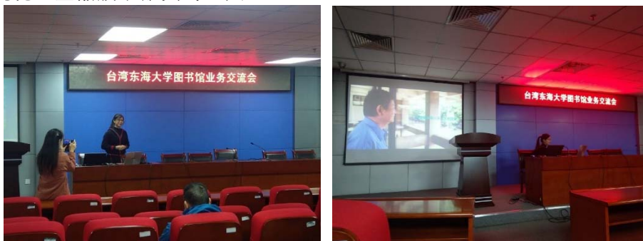
(圖 16：報告東海大學圖書館現況) (圖 17：播放館員的一天)