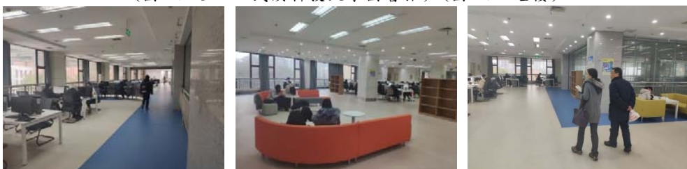
(圖 46：新聞覽室)(圖 47 及 48：新聞覽室)

武漢科技大學圖書館的志願者服務隊也非常特別；志願者服務隊基本上由學生社團脫胎而來，總數突破千人，已經可以自我管理，館員每年僅僅只是提供志願者優先的自修空間、工作學習及工讀的機會，其餘的訓練工作基本上由資深的志願者學長姐帶領新進的學弟妹工作學習，這樣的志願者團隊確實對圖書館的日常工作起了非常大的作用。