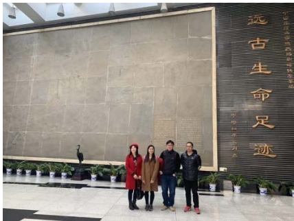
(圖 21：巨大的古代遺跡標本)

是礦產開採，因為近年來，中國大陸的環保意識逐漸抬頭，採礦這類型的高污染產業變的限制重重，進而影響到他們這些專業的就業前景，某程度上也是另一種類型的產業轉型。