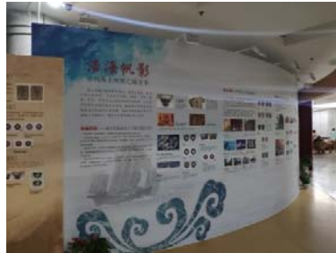
(圖 41 及 43：一帶一路特展海報)

貨幣金融歷史博物館位於圖書館一樓，館內的收藏主要是從古至今的錢幣，例如春秋時代的刀幣及銅錢；目前正在展出由中國銀行贊助的一帶一路各國錢幣特展，很特別的是，特展的各國錢幣是以浮貼的方式，黏在可以拉出的玻璃牆上，這種展出的方式是很少見的；在博物館的網站中，可以看到 360 度全景的博物館導覽( http://sosomap.cn/api/view/pano/zncdhhbirlsbwg )。