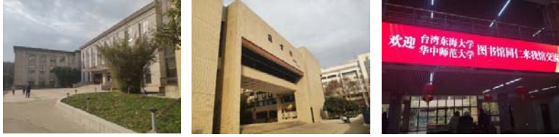
(圖 51：被列為歷史建築的老圖書館)(圖 52：70 年代的圖書館)(圖 53：歡迎海報)