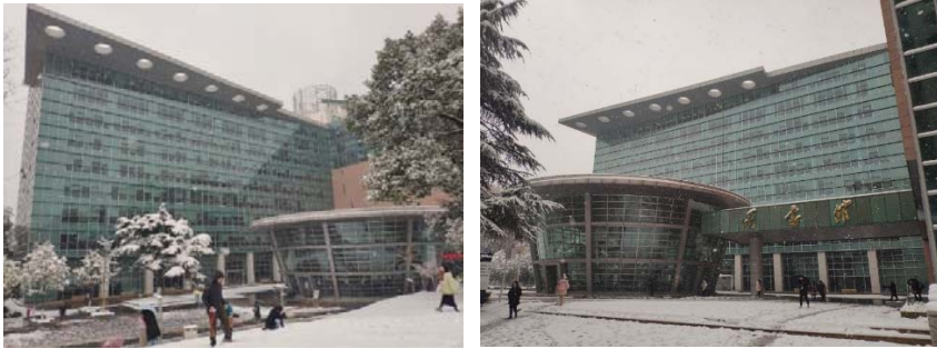
(圖 1 及圖 2：華中師範大學圖書館外觀)

華中師範大學源於美國聖公會在 1871 年創立的文華書院，1953 年改制成華中師範學院，1985 年改為現名；圖書館則是在 1951 年時，合併原華中大學、中華大學及中原大學教育學院所組成，1985 年時隨學校一起改名。圖書館的建築高達八層樓高，從照面中可看到屋頂的飛簷有著特別裝飾的圓洞，主建築物旁有一個外觀是倒圓錐形的小廳。