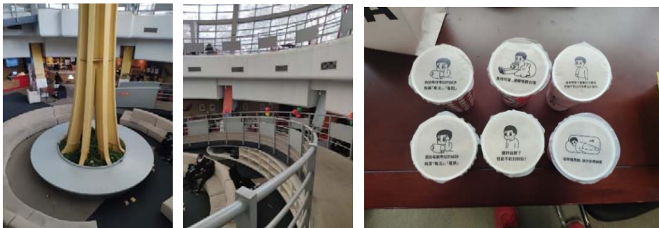
(圖 3 及圖 4：咖啡廳內部)

兩棟建築物底下有通道相連，小廳是圖書館的咖啡廳及電影院，我們經過的時候往往是座無虛席，非常受到學生歡迎。