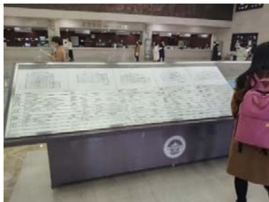
(圖 24：武漢大學圖書館內部分佈圖)

武漢大學圖書館也積極和各大數據庫商進行推廣活動，例如 Wiley 及 Ebsco。