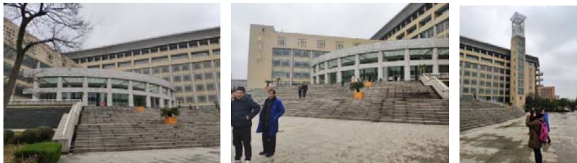
(圖 43 及 44：武漢科技大學圖書館)(圖 45：鐘樓)

用了許多的新科技產品，例如彎曲屏幕等，整體空間更使用了許多特別的設計，例如醫院的抗菌地板、造型沙發以及柔光燈管等，令人驚訝的是，裝修完的閱覽室幾乎沒有任何味道，這是非常少見的。