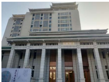
(圖 23：武漢大學圖書館入口)

武漢大學圖書館則是我們參觀的第二個圖書館；武漢大學圖書館是由五棟建築物相連起來的建築群構成；根據接待的館員指出，武漢大學因為合併了幾個高校，加上本身是武漢地區首屈一指的大學，學生數高達十萬人，所以除了軍事以外，幾乎所有的學科都是圖書館必須收錄的專業，因此也促成武漢大學圖書館的館舍非常龐大，而且有非常多的分館。