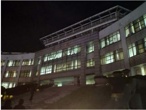
(圖 39：中南財經政法大學圖書館)

今日的財經政法大學圖書館；和華中師範大學圖書館一樣，同樣提供自助咖啡機供入館的讀者購買。