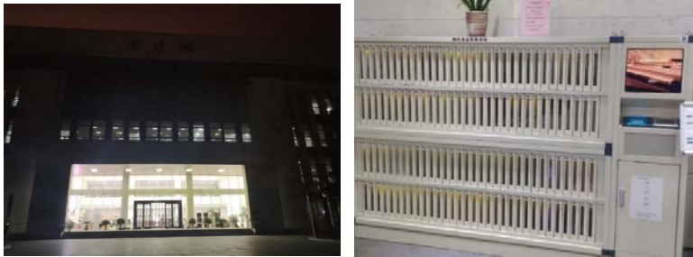
(圖 30：武漢大學信息學院圖書館入口) (圖 31：預約書取書機)

武漢大學信息學院圖書館則是屬於新的圖書館，館內設有 3D 列印機，同時也展示許多學生 3D 列印的作品，借書和預約書區則是完全無人化自助取書。