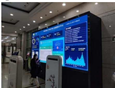
(圖 35：雙塔樓圖書館) (圖 36：入館屏幕)

中南民族大學民族學博物館也是由吳澤霖所創建的，館舍是一個仿造的四合院並融入少數民族建築特色，目前收藏了壯、苗、黎、土家、瑤等民族为主的少数民族文物藏品一萬多件。