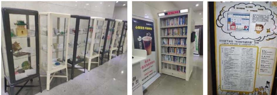
(圖 32：3D 打印成品展示區)(圖 33：新書展示區)(圖 34：專題講座海報)