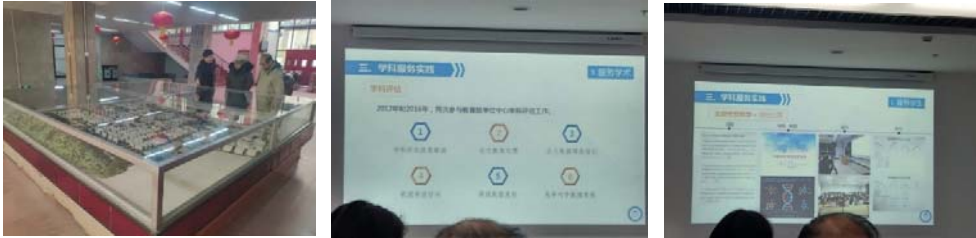
(圖 54：校園全景縮圖)(圖 55：文獻檢索課程)(圖 56：研究評估及學科評估)

總結我們一個月的所見所聞，武漢地區的大學圖書館確實擴展了我們的視野；但是，和許多館員的會談中，也感受到他們對於圖書館的事業，以至於整個高等教育事業的憂心，首先，大多數的圖書館都面臨了館藏空間不足的情況，以華中師範大學圖書館為例，一年的新書量大約在五萬冊左右，等同於增加一個新的書庫的館藏量，館藏的增加超過了館藏空間的增加，然而，武漢地區的大學院校依然處在校園擴張的時期，華中師範即將啟用南湖校區的分館，華中科技大學預計將會再興建一個 4 萬平方米的新館，以滿足每位學生平均需求的圖書館面積及館藏數(華中科技大學有七萬學生)，因此，武漢地區大專院校圖書館目前不會像東海一樣面臨館舍不足的問題。