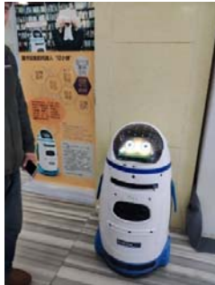
(圖 8 及圖 9：機器人叮小胖)

在圖書館參訪的期間，我們也參加了朱立紅老師主持的圖書館讀書會活動；讀書會目前是以圖書館的經典閱讀文庫為主要活動地點，閱讀的書籍主要還是以小說為主；同學在讀書會分享過徐浩的武俠小說，以及電影觀賞。