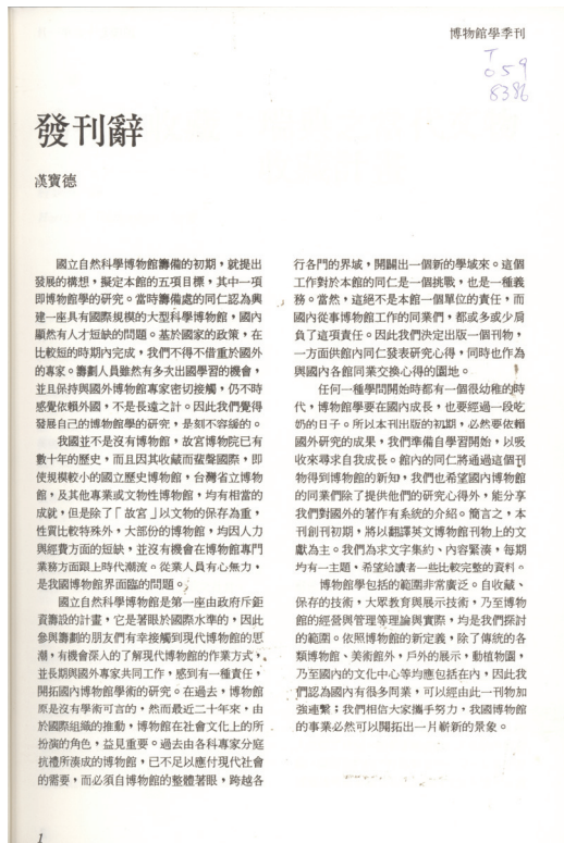
《博物館學季刊》創刊號發刊辭

博物館學包括的範圍非常廣泛。自收藏、保存的技術，大眾教育與展示技術，乃至博物館的經營與管理等理論與實際，均是我們探討的範圍。依照博物館的新定義，除了傳統的各類博物館、美術館外，戶外的展示，動植物園，乃至國內的文化中心等均應包括在內，因此我們認為國內有很多同業，可以經由此一刊物加強連繫，我們相信大家攜手努力，我國博物館的事業必然可以開拓出一片嶄新的景象。