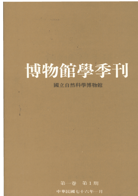
《博物館學季刊》創刊號封面

《博物館學季刊》創刊號目錄為橫式編排，本期刊登除了發刊辭外，收錄約有 13 篇文章。內容涵蓋當期專題，自收藏、保存的技術，大眾教育與展示技術，乃至介紹國內外博物館的經營與管理等理論與實際之經驗文章，以及具有參考借鏡的博物館學書評。